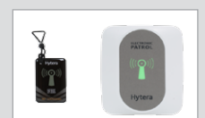
RFID-Zubehör für das Patrol System (PD415)