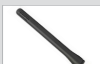
Antenne (UHF oder VHF)