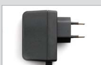
Netzteil für Ladeschale PS1018