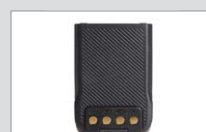
Lithium-Ionen-Akku (2000mAh) BL2010