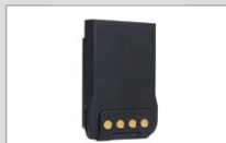
Lithium-Ionen-Akku (1500mAh) BL1504