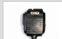
Lautsprechermikrofon (IP55) SM13M1