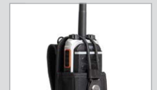
Tragetasche (Nylon) NCN011